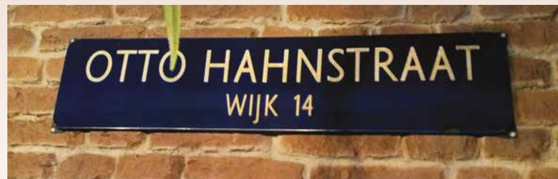
25 Straatnaambord Interieurfoto café Otto Hahn, Binnenhof.

Eerder al aangegeven: historie is van ons allen! Een aantal voorbeelden: hoe heette ook alweer de tijdelijke supermarkt nabij de Zernikeflat (14-hoog) toen het winkelcentrum Binnenhof nog in aanbouw was?