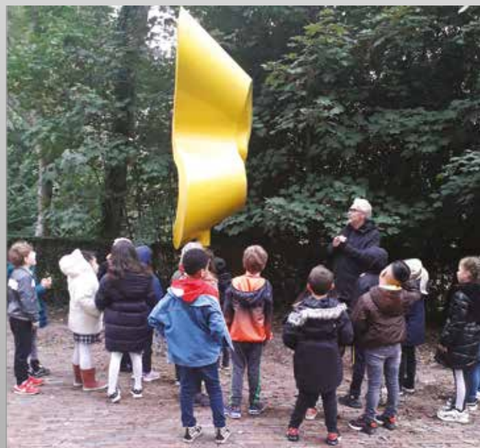
Kunstwandeling Ommoord met groep 4 van de Minister Marga Klompéschool