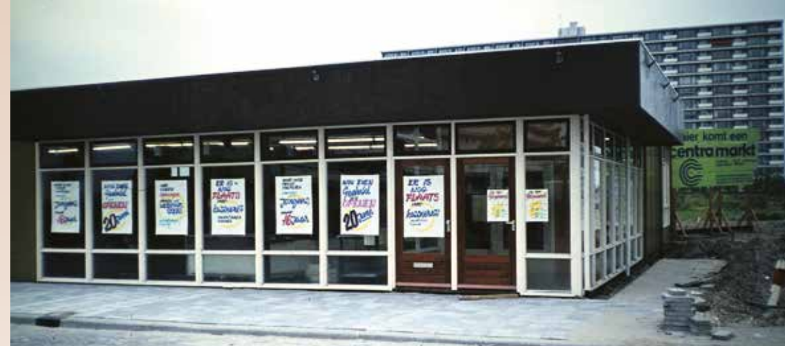
Centramarkt voorgevel aan de Niels Bohrplaats 15.