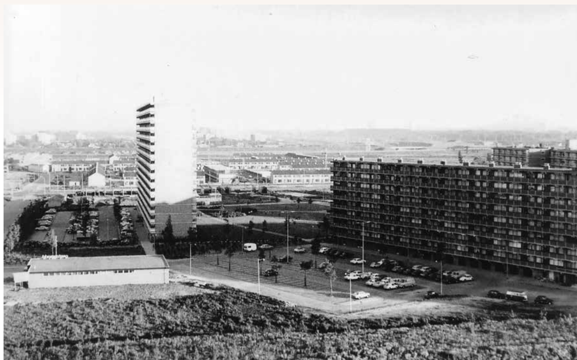
Historische Commissie 'De Ommoordse Polder'

Niels Bohrplaats met links Centramarkt. Foto M.J. van Aghoven 1973 Collectie HC De Ommoordse Polder-Bh 110