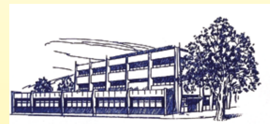
50 jaar Gezondheidscentrum Ommoord

Onze missie blijft: leveren van de best mogelijke zorg, preventie van klachten en het bevorderen van het welzijn van de bewoners van Ommoord.