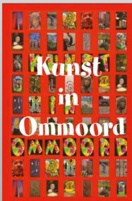
Boek "Kunst in Ommoord"

Sinds 2009 is er ook het boek "Kunst in Ommoord" dat nog meer uitgebreide informatie geeft. Dit onder meer door interviews met de makers van deze kunstwerken. Dit boek wordt regelmatig bijgewerkt en onlangs verscheen de nieuwe bijgewerkte 5e druk. Het boek "Kunst in Ommoord" wordt on-demand gedrukt. U kunt dit bestellen via 24bookprint.com/shop , titel "Kunst in Ommoord" (€ 19,25)